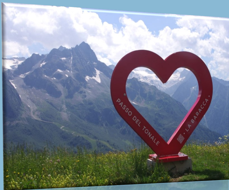
Sulle ferrate del Tonale – 27 luglio 2024

Invieremo invece come al solito il libretto delle gite sezionali che troverete anche sul nostro sito https://www.caicervasca.it .