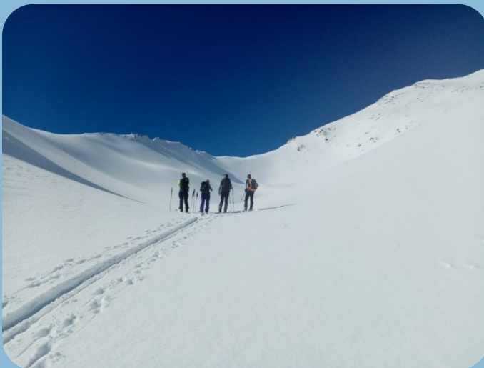
Gita sci alpinismo – Valle Stura – inverno 2024

https://aineva.it/ (monitoraggio neve e bollettini valanghe)