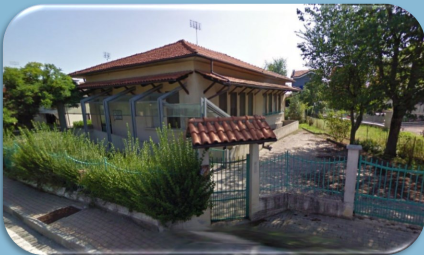
Vista dall'esterno della sede