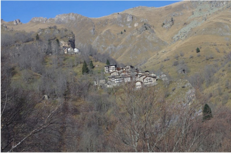
Giro delle borgate di Castelmagno (Valle Grana) – 24 novembre 2024