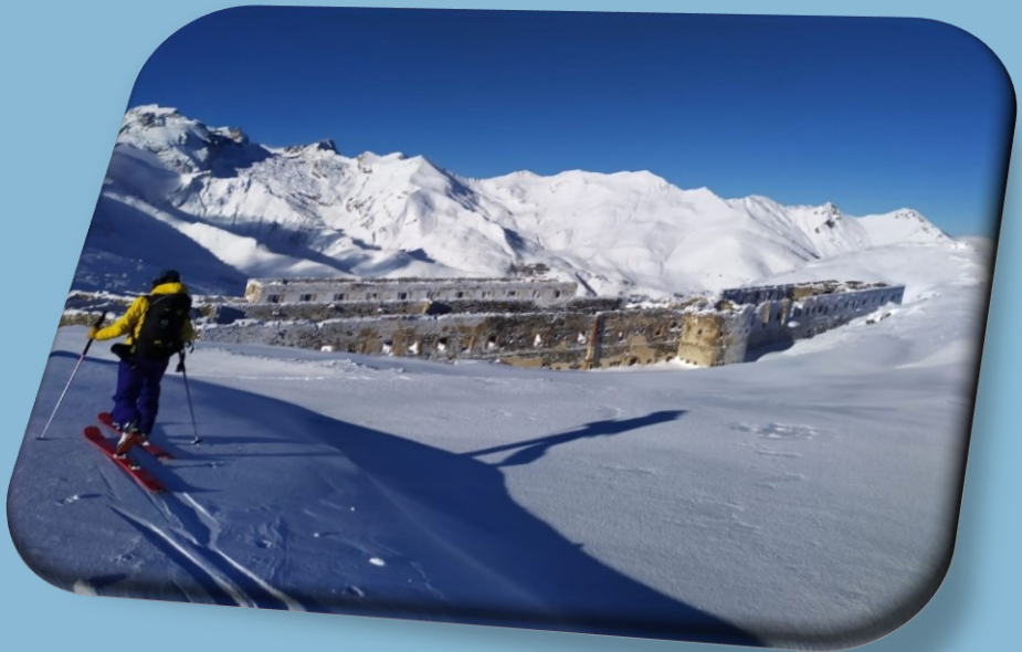
Forte Centrale Limone – inverno 2024

Dopo il calo dovuto al COVID, da un paio di anni c'è stata un'inversione di tendenza significativa.